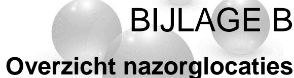
Tabel 7 Nazorglocaties en prioritering (bijlage C geeft voor de gearceerde locaties alle kenmerken weer) 72