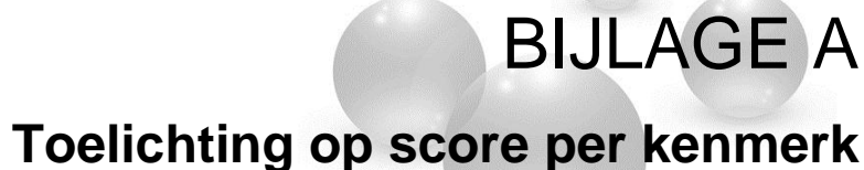
Tabel 6 Toelichting op scores per kenmerk