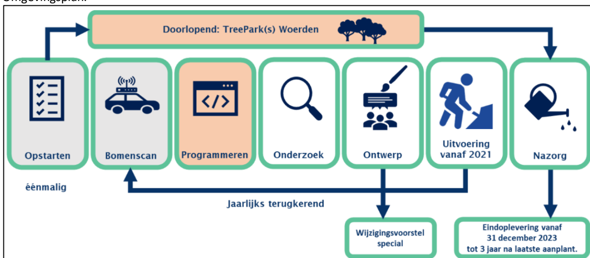
Een schematische weergave van het cyclisch proces van TreeMark.

Voor de onderliggende uitgangspunten voor operatie TreeMark wordt in stukken verwezen naar het Groenblauw Omgevingsplan.